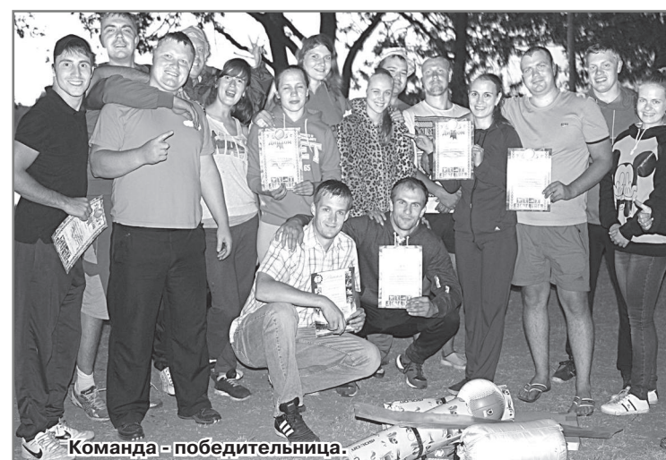
Команда - победительница.