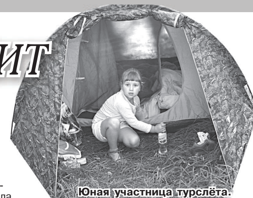
Юная участница турслета.

Волейбольный турнир стал последним видом турслета и из-за дефицита времени впервые был проведен по